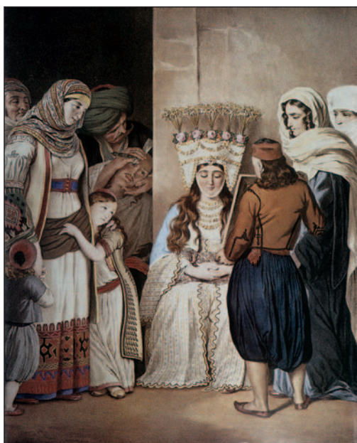
Εικ. 1.10 Ετοιμασία γάμου στην Παλιά Αθήνα (Αθήνα, Γεννάδειος Βιβλιοθήκη)

Τα ήθη, τα έθιμα και οι παραδόσεις του ελληνικού λαού προέρχονται κυρίως από την αρχαιότητα και το Βυζάντιο και συνδέονται συχνά με τη χριστιανική θρησκεία. Έχουν δεχτεί, επίσης, επιδράσεις από τους διάφορους κατακτητές και από τους γειτονικούς λαούς. Σχετίζονται, μάλιστα, στενά με την Οικιακή Οικονομία , μια και αφορούν την καθημερινή ζωή του ανθρώπου και της οικογένειας. Συγκεκριμένα, διακρίνονται σε δύο κατηγορίες :