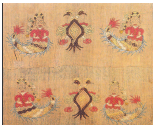
Εικ. 1.9 Κέντημα με γοργόνες και δικέφαλο αετό από τη Σκύρο (Αθήνα, Μουσείο Μπενάκη)