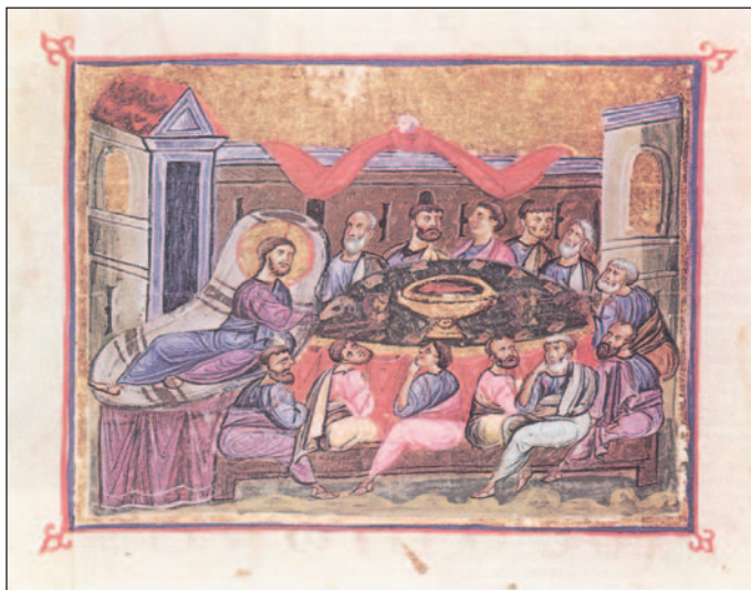
Εικ. 1.4 Ο Μυστικός Δείπνος (Μικρογραφία. Άγιο Όρος, Μονή Διονυσίου)

Οι βασικές τροφές των Βυζαντινών ήταν οι εξής με σειρά κατανάλωσης: άγρια χόρτα, βολβοί, όσπρια, οπωρικά, γαλακτοκομικά, λίπη, κρέατα, κρασί, σιτηρά, λάδι, αβγά, ψάρια, καρνεύματα. Εάν εξαιρέσουμε ελάχιστες περιοχές της αυτοκρατορίας που παρήγαγαν λάδι, για τους περισσότερους αυτό ήταν λιγιστό και πολύτιμο. Αντί για λάδι, στη διατροφή χρησιμοποιούσαν λίπη, γαλακτοκομικά και μια σάλτσα από μικρά ψάρια, το λεγόμενο γάρο .