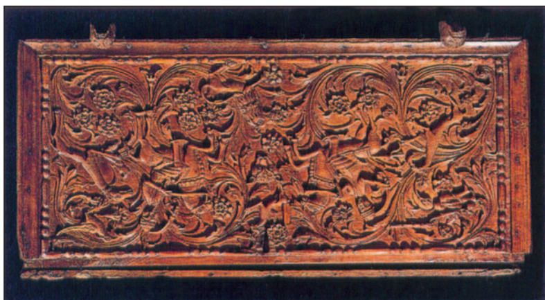
Εικ. 1.7 Χαρακτηριστικό έργο ελληνικής λαϊκής τέχνης: Ξυλόγλυπτη κασέλα από την Ήπειρο (Αθήνα, Μουσείο Μπενάκη)

Η ελληνική λαϊκή τέχνη έχει τις ρίζες της στο Βυζάντιο. Έχει επηρεαστεί, επίσης, από την τέχνη της Ανατολής και της Δύσης. Συγγενεύει, μάλιστα, ιδιαίτερα με την τέχνη των άλλων βαλκανικών λαών. Τα έργα της είναι δημιουργίες ανθρώπων που δε διδάχτηκαν την κάθε μορφή τέχνης σε σχολές, αλλά από έμπειρους τεχνίτες.