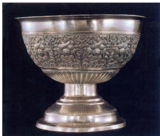
Εικ. 1.8 Ασημένια λεκάνη αγιασμού από την Καισάρεια της Μ. Ασίας (Αθήνα, Μουσείο Μπενάκη)

Η λαϊκή τέχνη αποτελεί ένα σπουδαίο κεφάλαιο της πολιτισμικής μας κληρονομιάς . Υπήρξε επίσης σημαντική πηγή έμπνευσης διάφορων Νεοελλήνων καλλιτεχνών.