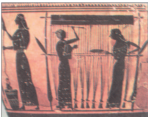
Εικ. 1.1 Γυναίκες που κατασκευάζουν τα ρούχα της οικογένειας: μία γνέθει και δύο υφαίνουν (Αγγείο, Ν. Υόρκη, Μητροπολιτικό Μουσείο)

Η Οικιακή Οικονομία έπαιξε μεγάλο ρόλο στην εξέλιξη του ελληνικού πολιτισμού, γιατί συνδεόταν πάντοτε με την οικογένεια, τον πυρήνα, δηλαδή, της κοινωνίας που δημιουργεί κάθε πολιτισμό. Συγκεκριμένα, η Οικιακή Οικονομία αναφέρεται στον τρόπο οργάνωσης της ζωής της οικογένειας, στα οικονομικά της, στη διατροφή των μελών της, στις σχέσεις μεταξύ τους και με άλλους ανθρώπους, στην κατοικία και στην ενδυμασία τους.