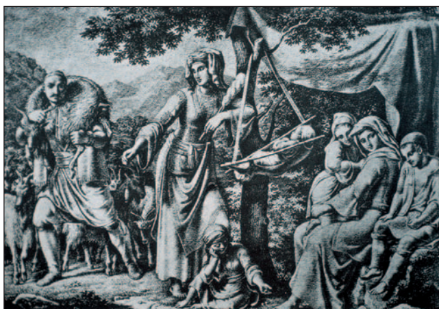
Εικ. 1.5 Ποιμένας επιστρέφει από τη βοσκή. Οι γυναίκες ασχολούνται με το γνέσιμο και τη φροντίδα των παιδιών (Αθήνα, Γεννάδειος Βιβλιοθήκη)

Στα χρόνια που ακολούθησαν την πτώση του Βυζαντίου, οι άντρες ασχολούνταν με τις εξωτερικές εργασίες και οι γυναίκες με το σπίτι, ακολουθώντας την παράδοση. Ωστόσο, επειδή πολλοί άντρες ξενιτεύονταν ή έλειπαν αρκετούς μήνες από το σπίτι ως ναυτικοί ή περιοδεύοντες έμποροι ή τεχνίτες, οι γυναίκες σε αυτές τις περιπτώσεις αναλάμβαναν όλη τη διοίκηση του σπιτιού και τις ευθύνες της οικογένειας. Στις αγροτικές οικογένειες βοηθούσαν, επίσης, τους συζύγους τους στις δουλειές τους. Οι γυναίκες ήταν υπεύθυνες, εξάλλου, για τη φροντίδα των παιδιών, καθώς και των ηλικιωμένων μελών της οικογένειας που ζούσαν μαζί της.