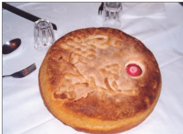
Εικ. 1.6 Παραδοσιακό στολισμένο ψομί από τη Γορτυνία

Μεγάλη σημασία δινόταν στη φιλοξενία . Σύμφωνα με τις πατροπαράδοτες συνήθειες, στο φιλοξενούμενο προσφερόταν όσο το δυνατόν πιο πλούσιο γεύμα και στρώνονταν τα καλύτερα σεντόνια και σκεπάσματα για να κοιμηθεί. Όπως περιγράφει ένας ξένος περιηγητής, σε έναν αρχοντικό πύργο της Μάνης: «Για τον ύπνο (στους φιλοξενούμενους) άπλωσαν στο πάτωμα στρώματα, μαξιλάρες και κεντητά σεντόνια από φαρδιές λουρίδες μουσελίνας και χρωματιστό μετάξι, όλα έργα των χεριών των γυναικών της οικογένειας».