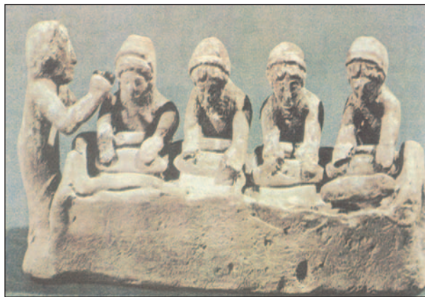
Εικ. 1.2 Γυναίκες που ζυμώνουν ψωμί υπό τους ήχους δάνυλον (Ειδώλιο, Παρίσι, Μουσείο Λούβρου)

Απαραίτητο στοιχείο της οικογενειακής ζωής ήταν και η φιλοξενία , η οποία είχε πολύ σημαντική θέση στον αρχαίο ελληνικό κόσμο. Όταν, μάλιστα, ο φιλοξενούμενος ετοιμαζόταν να φύγει, συνήθιζε να ανταλλάσσει με τον οικοδεσπότη δώρα, που συμβόλιζαν τη φιλία η οποία είχε δημιουργηθεί μεταξύ τους.